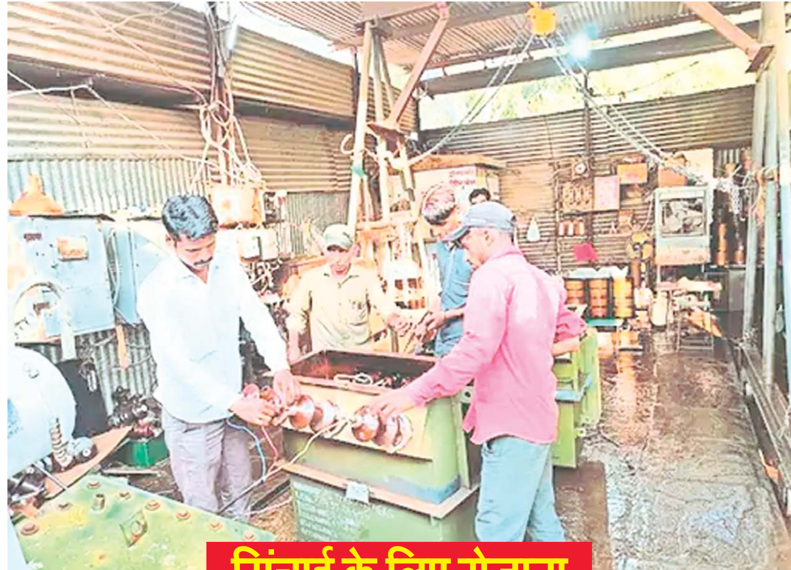
पालो कार्यालय मंदसौर